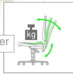
Synchrontechnik mit Gewichtsregulierung